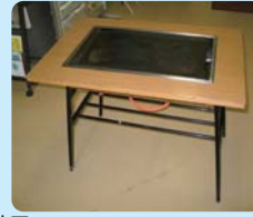
とうもろこしカ焼き機