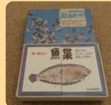
魚魚あわせ (隠岐・出雲・石見)