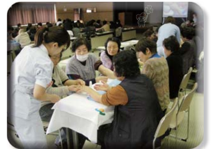
2月25日（四国中央市福祉会館）