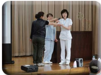
2月19日（川之江文化センター）