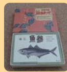
魚魚あわせ (京都・丹後)