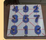
輪投げ&陣取りゲーム