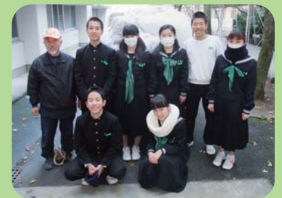
「もっときれいに気持ちよく」とさんと北中生徒会の皆さん♪

12月16日川之江北中学校の生徒やPTAの皆さんで集めたエコキャップを寄贈してくださいました。ありがとうございました。【92,000個が集まり115人の子どもにポリオワクチンを接種できます。】