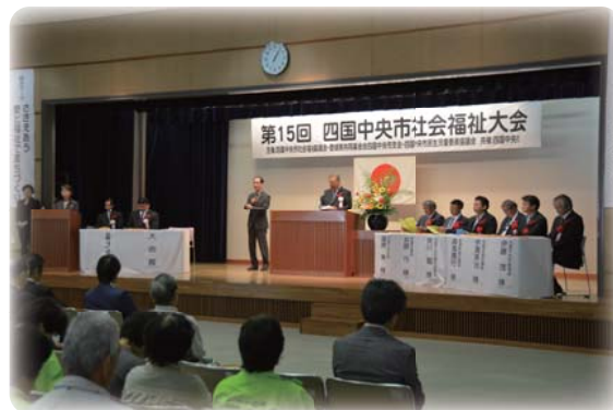
昨年度の社会福祉大会